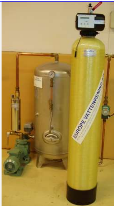
Europe Filtersystem för hydrofor

Vill du veta mer? I så fall är vårt Tel 0478-10017