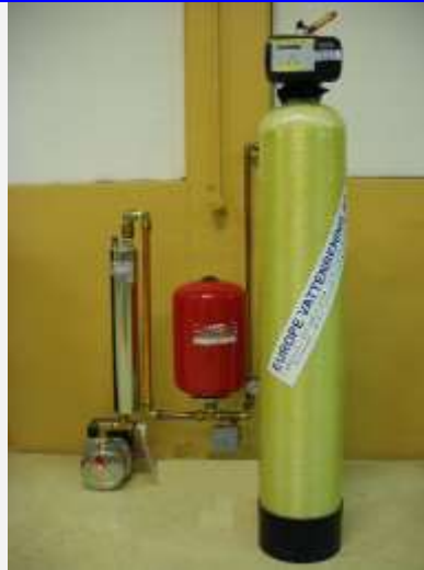
Europe Filtersystem för Hydropress/Wellmate trycktank Inkl. Luftblandare som syresätter, vattenfilter samt tillbehör enligt nedan.

Avlägsnar Järn, Mangan, Uran, färg, Svavelväte lukt, humusbundet järn, balanserar pH-värdet, eliminerar aggressiv kolsyra.